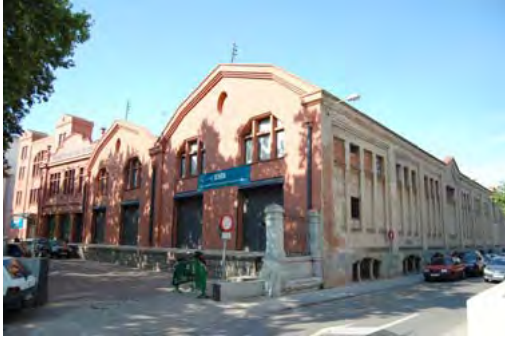
Figura 7. Edifici Acondicionaments i Docks de 1897. Conservat, actual seu de l'ESDI (zona número 5)